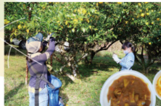
11月24日 山がっこにて【ゆずとり体験】を行いました。