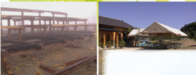
小屋組みの組立て 平成17年5月落成式