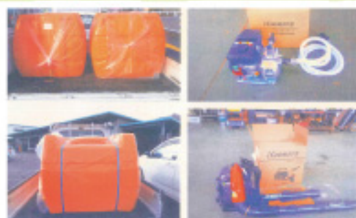
上記備品を購入しました。 11月27日「タンクローリー 500ℓ」 1月8日「プロア」「ポンプ」