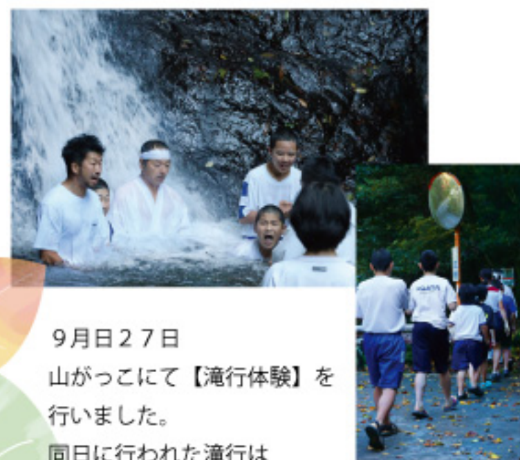
9月27日 山がっこにて【滝行体験】を行いました。 同日に行われた滝行は「東米良創生会ホームページ」で紹介しています。YouTubeチャンネルでも閲覧できます。