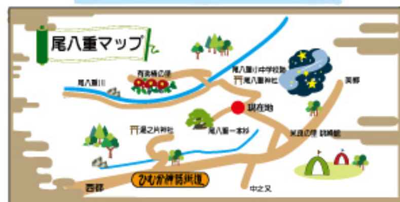
尾八重神社前へ尾八重マップ看板を設置予定です。