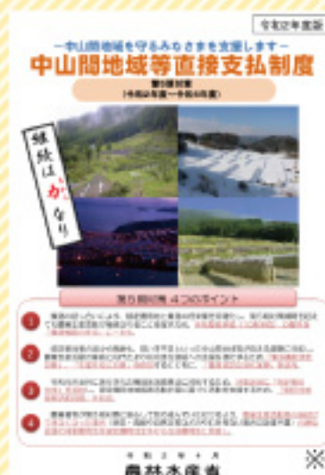
※農林水産省 HP より